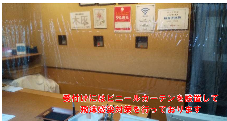
受付にはビニールカーテンを設置して 飛沫感染対策を行っております