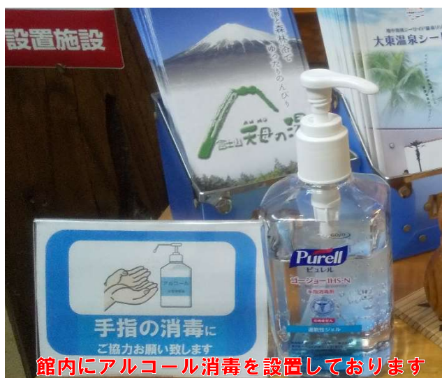
館内にアルコール消毒を設置しております