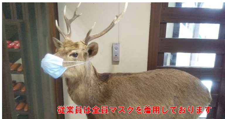
従業員は全員マスクを着用しております

ウイルス感染拡大を防ぐため、ヴィラ雨畑では下記の取り組みを行っております。 お客様にはご迷惑をおかけいたしますが、ご理解・ご協力の程、お願い申し上げます。