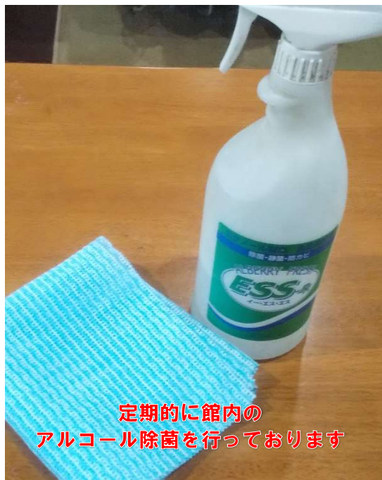
定期的に館内の アルコール除菌を行っております