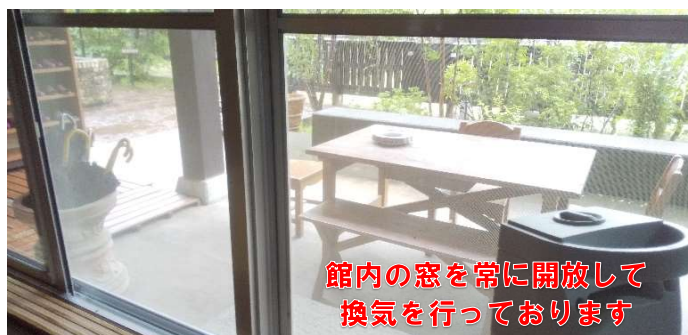
館内の窓を常に開放して 換気を行っております

また、発熱、咳、倦怠感などの症状や体調のすぐれない場合は入館をご遠慮いただく場合があります。 ご理解とご了承の程、お願い申し上げます。